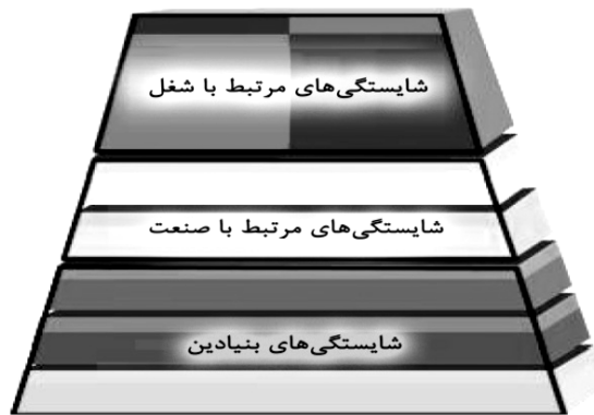
شکل ۱. ساختار کلی هرم شایستگی وزارت کار امریکا

هریک از این بخش‌ها، خود از چندین لایه که در بردارنده مجموعه‌ای از شایستگی‌ها می‌باشند (شکل ۲) تشکیل شده است که نشان‌دهنده مهارت‌ها، دانش و توانایی‌های اساسی لازم برای دستیابی به موفقیت در یک حرفه می‌باشند. در صورتی که از قاعده هرم به سمت رأس آن حرکت کنیم، سه لایه اول این هرم، شایستگی‌هایی را در بر می‌گیرد که برای مشاغل و صنایع مختلف، مشترک است. این شایستگی‌ها که به «مهارت‌های نرم» معروفند، برای ورود و موفقیت در اغلب مشاغل ضروری می‌باشند. لایه‌های ۴ و ۵ که در بخش بعدی قرار می‌گیرند، شایستگی‌های مرتبط با صنعتی خاص را در خود جای می‌دهند و برای مشاغل مختلف در آن صنعت خاص مشترک می‌باشند. البته با توجه به گستردگی صنعت و مشاغل زیرمجموعه ICT، شایستگی‌های فنی هر یک از زیربخش‌های آن نیز متفاوت خواهد بود. لذا، با توجه به آنکه مدل ارائه شده،