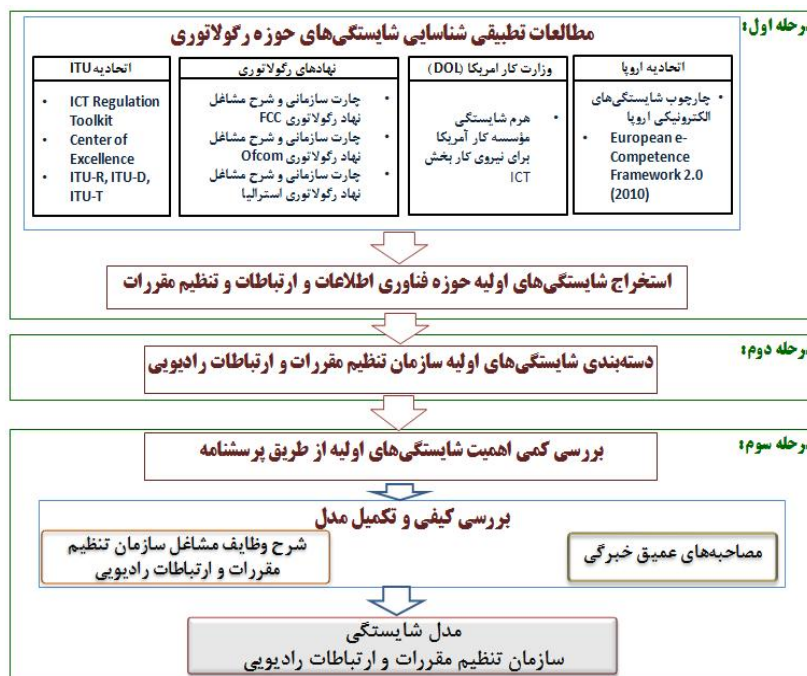
شکل ۳. مدل مفهومی شایستگی سازمان تنظیم مقررات و ارتباطات رادیویی

در مرحله اول، بر اساس منابع مختلف، شایستگی‌های اولیه در حوزه فناوری اطلاعات و ارتباطات و بحث تنظیم مقررات آن شناسایی می‌شوند. در مرحله دوم، شایستگی‌های اولیه به دست آمده، در لایه‌های اصلی که متناظر با شایستگی‌های متفاوت مورد نیاز سازمان می‌باشند دسته‌بندی می‌شوند. پس از تهیه فهرست اولیه شایستگی‌ها، لازم است این شایستگی‌ها مورد ارزیابی و اعتبارسنجی قرار گرفته، شایستگی‌های غیر مرتبط یا کم اهمیت حذف، شایستگی‌های مهم و مرتبط اضافه و شایستگی‌های مشابه با یکدیگر تلفیق شوند و در دسته‌ها و لایه‌های مناسب قرار داده شوند. در این راستا، از سه ابزار اصلی استفاده می‌شود: طراحی پرسشنامه و اجرای آن برای میزان اهمیت هر یک از شایستگی‌های استخراج شده از مطالعات مختلف برای سازمان توسط کارشناسان سازمان، مصاحبه با خبرگان سازمان تنظیم مقررات و ارتباطات رادیویی و در نهایت استفاده از شرح شغل و بیانیه‌های راهبردی سازمان برای تکمیل و نهایی سازی آن (شکل ۳).