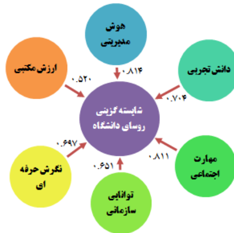
شکل ۲. مدل نهایی تحقیق به همراه ضرایب رگرسیون

معادله رگرسیون حاصل از این تحقیق، میزان شدت تأثیر هر یک از عوامل را در شایسته‌گزینی رؤسای مراکز و واحدهای دانشگاه پیام نور به ما نشان می‌دهد. پس برای انتخاب مدیرانی توانمند و شایسته، خصوصاً برای مدیران دانشگاهی می‌توان با در نظر گرفتن شاخص‌ها و عوامل شایستگی که دربرگیرنده نتایج این تحقیق است، مدیرانی لایق و