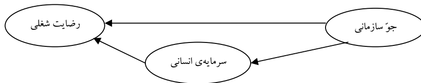
شکل ۲. مدل نظری مربوط به تأثیر جوّ سازمانی و سرمایه‌ی انسانی بر رضایت شغلی